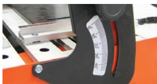
РІЗАННЯ ПІД КУТОМ 0 - 45°