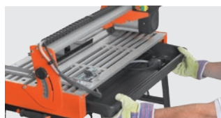
ЗМІННИЙ ЛОТОК ДЛЯ ВОДИ